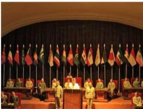
Diorama perundingan linggajati