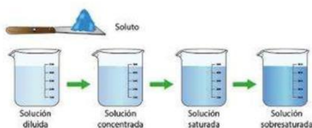
Imagen 1. Representación de la concentración de una disolución en términos cualitativos