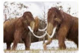
Orange County Register Giant woolly mammoth skeleton find...