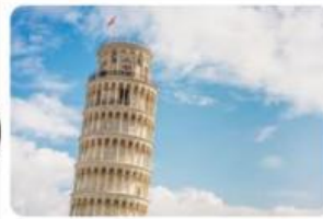
U.S. News Travel The 32 Most Famous Landmarks in the...

Hoàng gia Voi ma mút Địa danh Bằng len Có giá hơn ... Mọi người ; Dân gian Chính trị gia. Khổng lồ Chứa