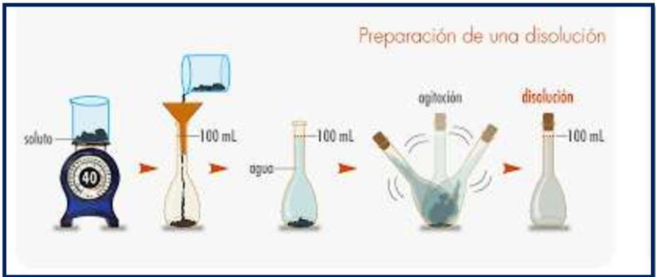
Imagen 1. Proceso de preparación de una disolución

Material elaborado por el profesor. Hernán López. Junio 2024