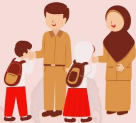
Bersalaman dengan guru Ketika bertemu