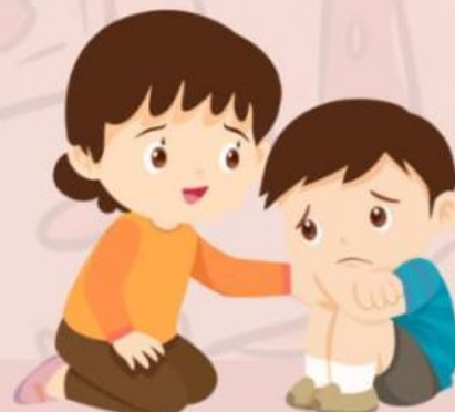
Menghibur teman yang sedang bersedih