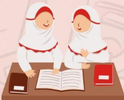
Membantu teman yang Tidak paham pelajaran