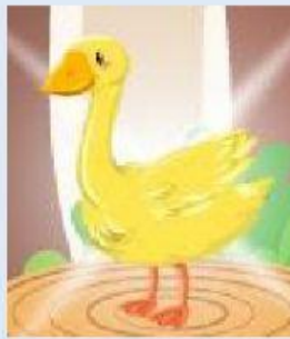
Un ganzo de oro