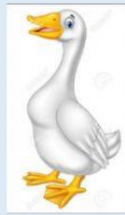
Un ganzo de plata