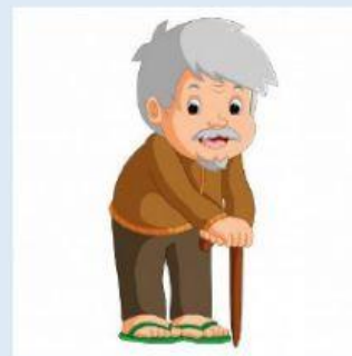
de pelo gris y muy viejo