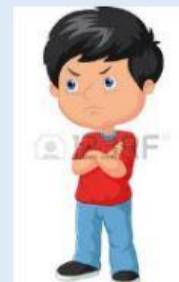
Se puso molesto