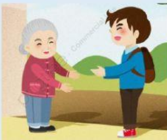
Compartió de su comida