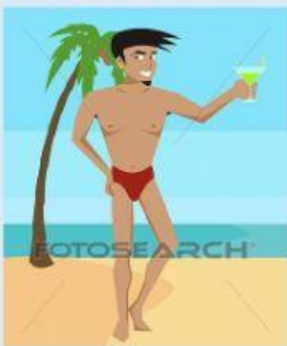
Joven y guapo