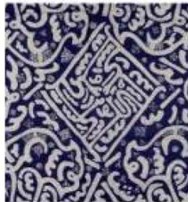
Gambar 3.1 Contoh Motif Batik Besurek

besurek diperkenalkan oleh para saudagar dan seniman batik dari Demak. Namun, ada pula yang berpendapat bahwa masyarakat Bengkulu mengenal metode batik dari hijrahnya Sentot Ali Basyah, panglima perang Pangeran Diponegoro, dari Jawa ke Bengkulu. Saat itu Sentot Ali Basyah ditemani oleh anak buah dan keluarganya diasingkan Belanda ke Bengkulu. Kabarnya mereka inilah yang mula-mula mengenakan kain batik dengan motif "surat".