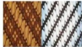
Batik parang Surakarta (kiri) Batik parang Yogyakarta (kanan)