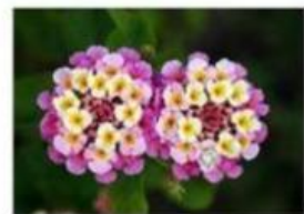
Perubahan warna bunga Lantana Camara. Bunga kuning dan putih baru mekar, bunga magenta lebih tua