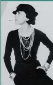
2. COCO CHANEL