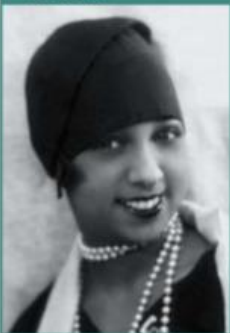
1. JOSEPHINE BAKER