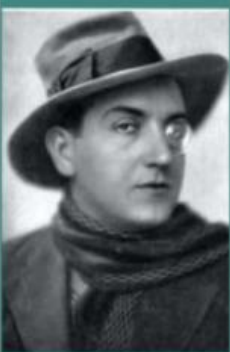
3. FRITZ LANG