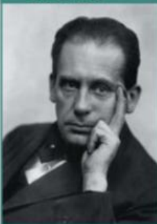
4. WALTER GROPIUS