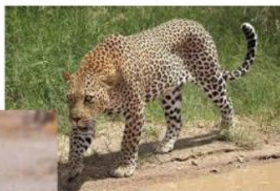
Los leopardos son más gorditos y más bajitos