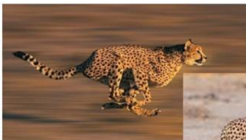
Guepardo corriendo Guepardo o chita

Los guepardos se parecen a los leopardos, pero estos son más bajitos y más gorditos, no son tan rápidos. Se parecen en que los dos tienen su pelo con manchas.