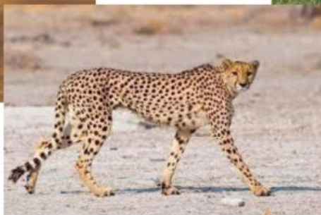
Guepardo o Chita