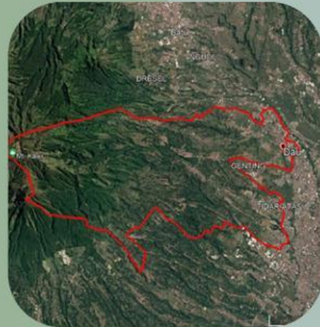
Kecamatan Dau Tahun 2024

Berdasarkan gambar citra periode di kecamatan Dau tahun 2014 & 2024 diatas, identifikasikan lahan pada citra tersebut lebih banyak dimanfaatkan untuk kepentingan apa? Tuliskan jawaban kalian pada kolom di bawah ini!