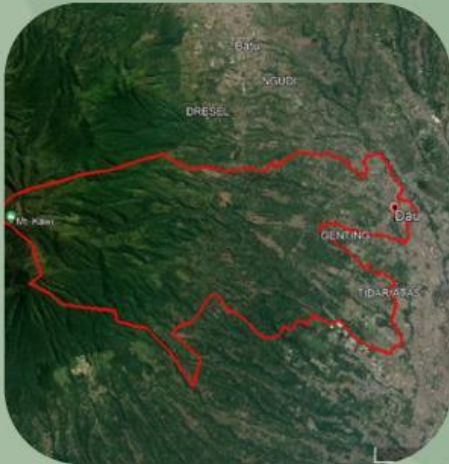
Kecamatan Dau Tahun 2014