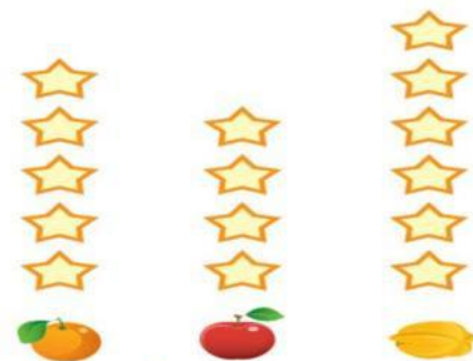
Diagram Buah Kesukaan