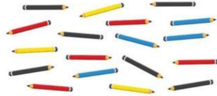
Tabel Pensil Warna