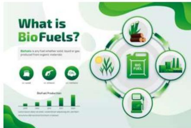
Gambar 1 Biofuel

Dewasa ini, penggunaan biofuel sebagai sumber energi menjadi perhatian khalayak ramai. Hal ini dikarenakan bahan bakar fosil yang digunakan saat ini merupakan sumber daya alam yang tidak dapat diperbarui sehingga sumber bahan bakar lebih cepat habis dibandingkan terbentuknya yang baru. Selain itu, pembakaran bahan bakar fosil menghasilkan asam sulfat dan asam nitrat yang dapat menyebabkan terjadinya hujan asam. Oleh karena itu, biofuel dijadikan sebagai salah satu solusi sebagai salah satu prioritas dalam mengembangkan energi terbarukan di Indonesia karena memiliki potensi sumber daya yang sangat besar