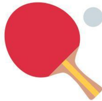
Ping Pong (N.)