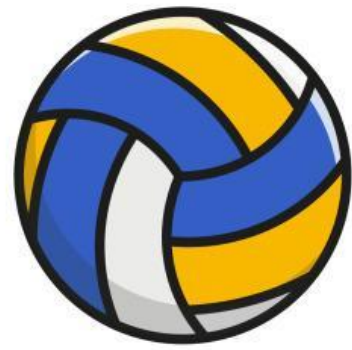
volley ball (N.)