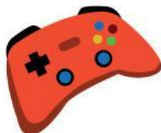
CONTROL PARA VIDEOJUEGOS