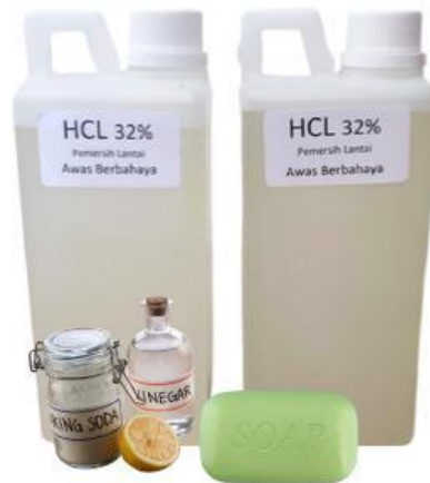
Gambar larutan asam basa dalam kehidupan sehari-hari