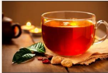
Gambar 2 Air Teh