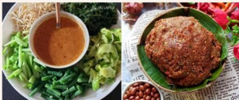
Gambar 4 Sambal pecel