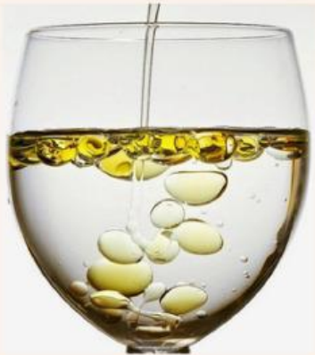
Gambar 3 Air Minyak