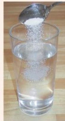
Gambar 4 Larutan Gula