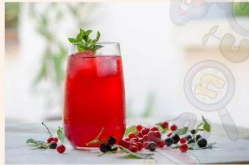
Gambar 2 dan 3 Susu dan Sirup