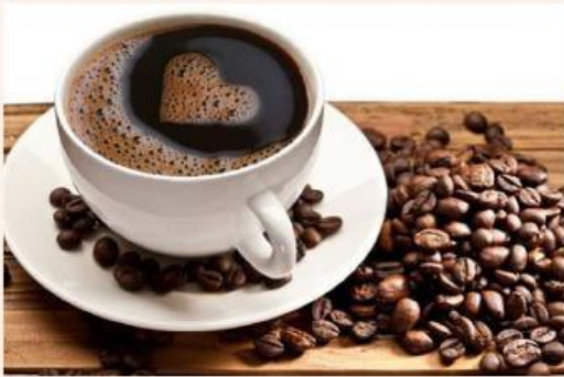
Gambar 1 Air Kopi