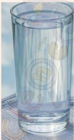
Gambar 1 Air Murni