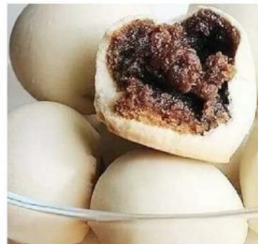
Mino Rasa Cokelat

Pada suatu pameran makanan tradisional, terdapat beberapa macam makanan khas Banyumas, salah satunya yaitu mino. Ada 3 jenis rasa mino, yaitu : mino rasa pandan, mino rasa gula jawa, dan mino rasa cokelat. Nia, Dina, dan Sinta tertarik untuk membeli jajanan khas dari Banyumas ini. Nia membeli 3 kg mino rasa pandan, 1 kg mino rasa cokelat, 1 kg mino rasa gula jawa dengan harga Rp.188.000,00 . Dina membeli 2 kg mino rasa pandan, 1 kg rasa cokelat, dan 1 kg mino rasa gula jawa dengan harga Rp. 136.000,00 . Sedangkan Sinta membeli 1 kg mino rasa pandan, 2 kg mino rasa cokelat, dan 4 kg mino rasa gula jawa dengan harga Rp. 196.000,00. Buatlah model matematika dari permasalahan tersebut! Selanjutnya identifikasi bentuk persamaan yang diperoleh!