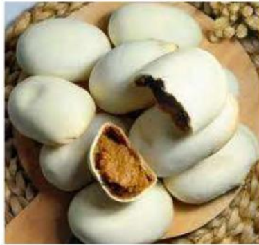
Mino Rasa Gula Jawa