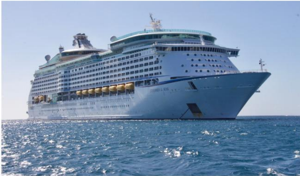
Gambar: kapal Laut

Kapal laut merupakan salah satu alat transportasi yang dapat dimanfaatkan untuk mengangkut penumpang atau barang. Tetapi mengapa kapal laut tidak tenggelam diatas air?