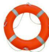
Ar dentro de boia