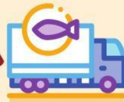
Ikan diangkut ke kota