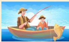
Nelayan menangkap ikan

Isilah dengan jawaban yang tersedia di kotak jawaban!