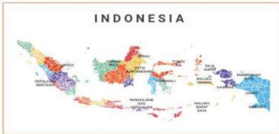
Gambar 4.2 Peta Indonesia