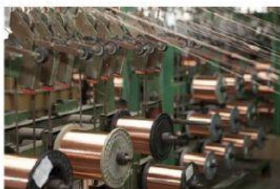
Fios de cobre