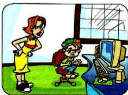
Imagem para as questões 3 e 4