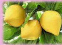
Quả lê ki ma