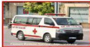
Xe cứu thương