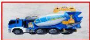
Xe trộn bê tông