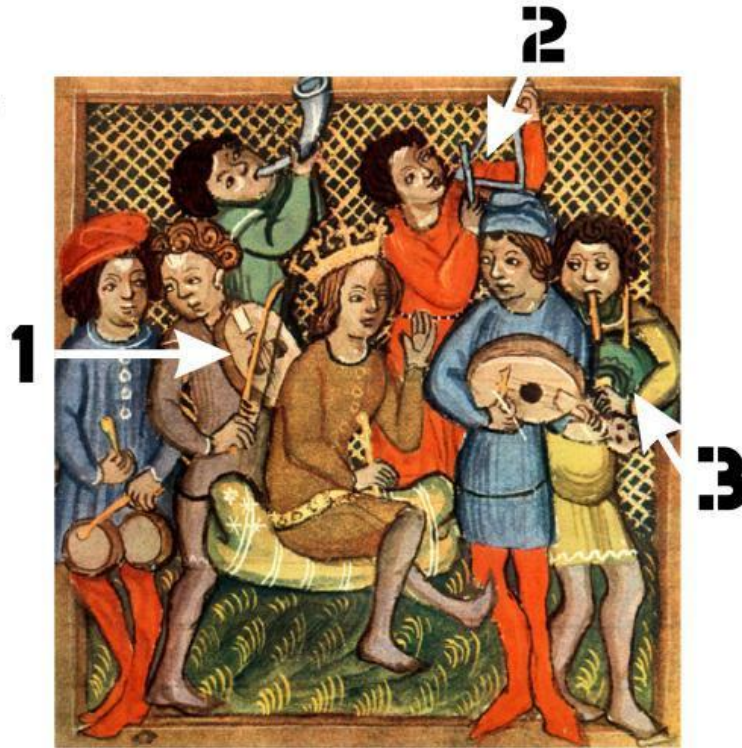
Juglares tocando varios instrumentos en una iluminación de la Biblia de Olomouc, 1417.

¿Sabrías identificar los tres instrumentos señalados?