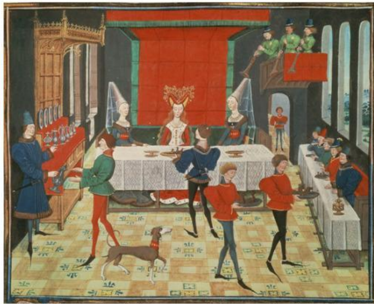
Banquete medieval. Ilustración de los poemas del compositor Reinaldo de Montauban. Siglo XV.