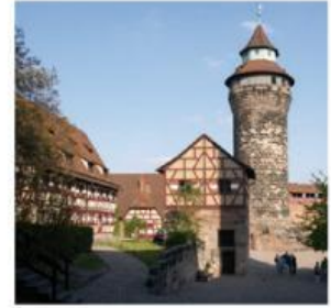
3. Nürnberg: die Burg