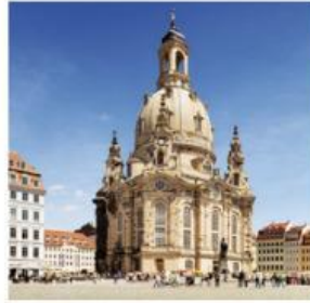
2. Dresden: die Frauenkirche