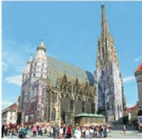
1. Wien: der Stephansdom