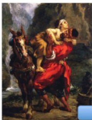
Regreso del hijo pródigo