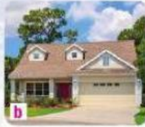
b En banlieue, dans un pavillon.