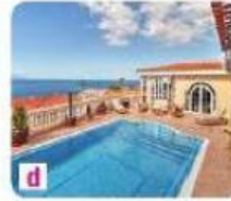
d À la mer, dans une villa.