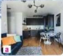
a Dans le centre-ville, dans un studio.