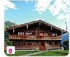
e À la montagne, dans un chalet.