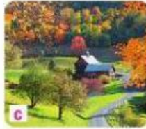
c À la campagne, dans une ferme.