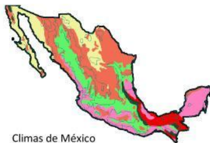
Climas de México