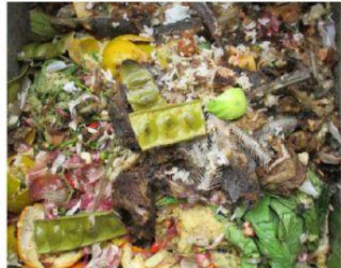
Sampah sisa makanan