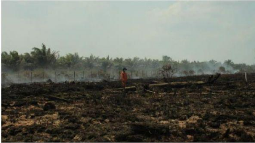
Ilustrasi kebakaran hutan dan lahan (Karhutla)

Isu perubahan iklim yang terjadi di bumi sudah tak asing lagi di dengar oleh kalangan masyarakat. Perubahan tersebut ditandai perubahan suhu, kelembaban dan curah hujan sehingga menyebabkan perubahan musim yang tidak menentu, kemarau dan kekeringan air terjadi dimanana-mana. Musibah Kebakaran hutan yang terjadi lahan di perkebunan PT. SIL 3 seluas 180 hektar, untuk PT. Indo Lampung seluas 30 hektar dan PTPN VII seluas 20 hektar. Sedangkan lahan PT. PML register 42 berjumlah 10 hektar dan PT. SIL 186,04 hektar Untuk lahan TNBBS seluas 100 hektar ada tahun 2019 lalu dipicu oleh kemarau yang panjang. hal tersebut mempunyai dampak yang besar terhadap ekosistem hutan yang mengakibatkan berkurangnya populasi dan keragaman spesies. Dalam hal ini salah satu spesies yang berkurang di Provinsi lampung adalah gajah sumatra ( Elephas maximus sumatrensis ) yang berkurang populasinya sekitar 69% karena kerusakan hutan tersebut (Maulina, Dina, dkk., 2019). Lalu bagaimana upaya kita dalam menanggulangi masalah perubahan iklim?