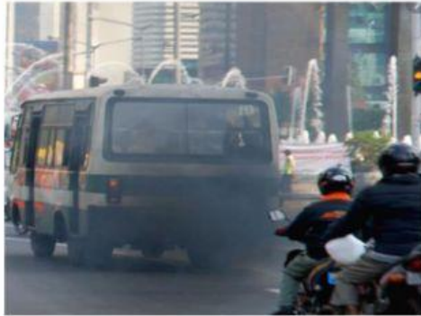
Penggunaan bahan bakar fosil pada kendaraan bermotor

Buatlah gagasan upaya penanggulangan perubahan iklim dengan memilih salah satu dari 4 fenomena penyebab perubahan iklim dibawah ini , lalu gagasan ditulis dengan format yang disediakan dikolom jawaban!