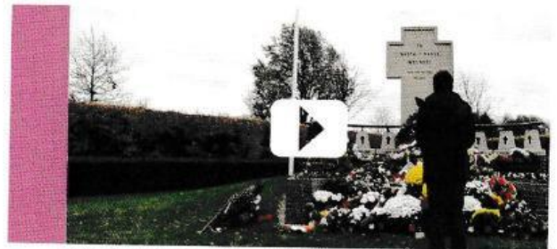
MultimediaRevolution.eu, Polonus 2015 – Migracje Polaków na przestrzeni dziejów, https://www.youtube.com/watch?v=HUuQCknvPrs&t