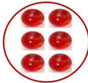
6 Kelereng merah