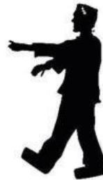
La créature de Frankenstein