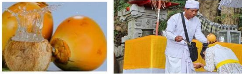
Gambar 1. Kelapa gading dan proses upacara melukat