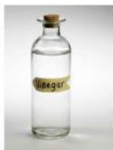
Gambar 2. Cuka Makanan