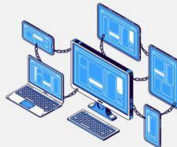
Infrastruktur jaringan komputer