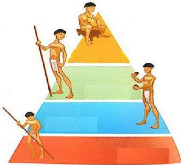
Pirámide social de los taínos.