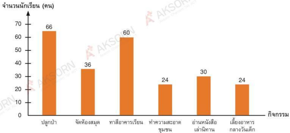
ความคิดเห็นของนักเรียนชั้นมัธยมศึกษาปีที่ 1 โรงเรียนอักษรเจริญวิทย์ เรื่องกิจกรรมจิตอาสาที่อยากทำมากที่สุด

ให้นักเรียนนำกิจกรรมจิตอาสาจากแผนภูมิแท่งข้างต้นมาแสดงเป็นแผนภูมิวงกลมให้อีกด้วย