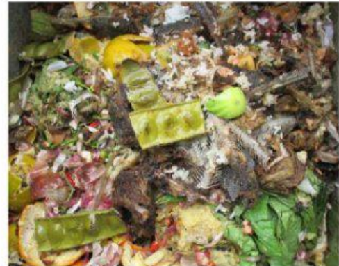
Sampah sisa makanan