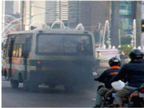
Penggunaan bahan bakar fosil pada kendaraan bermotor

Buatlah gagasan upaya penanggulangan perubahan iklim dengan memilih salah satu dari 4 fenomena penyebab perubahan iklim dibawah ini , lalu gagasan ditulis dengan format yang disediakan dikolom jawaban!