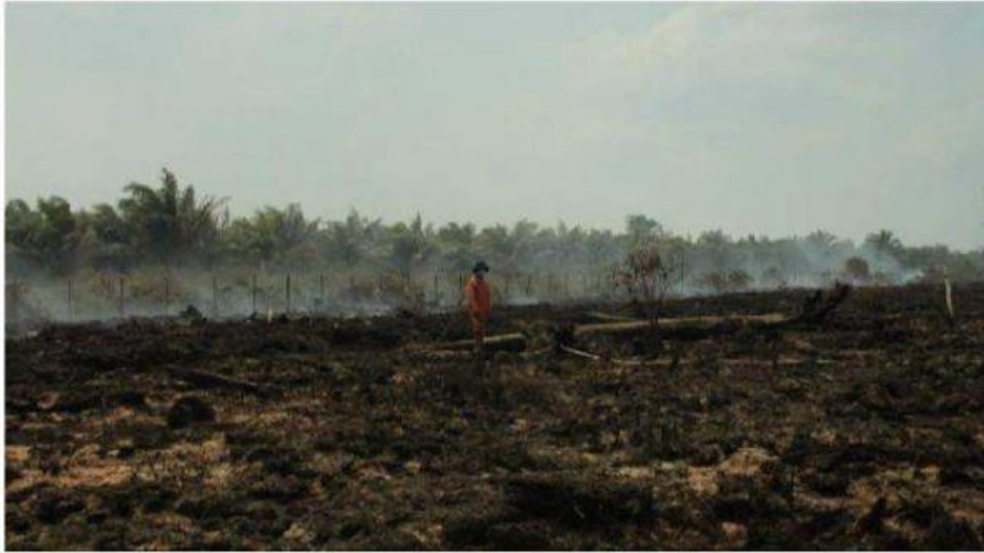
Ilustrasi kebakaran hutan dan lahan (Karhutla)

Isu perubahan iklim yang terjadi di bumi sudah tak asing lagi di dengar oleh kalangan masyarakat. Perubahan tersebut ditandai perubahan suhu, kelembaban dan curah hujan sehingga menyebabkan perubahan musim yang tidak menentu, kemarau dan kekeringan air terjadi dimanana-mana. Musibah Kebakaran hutan yang terjadi lahan di perkebunan PT. SIL 3 seluas 180 hektar, untuk PT. Indo Lampung seluas 30 hektar dan PTPN VII seluas 20 hektar. Sedangkan lahan PT. PML register 42 berjumlah 10 hektar dan PT. SIL 186,04 hektar Untuk lahan TNBBS seluas 100 hektar ada tahun 2019 lalu dipicu oleh kemarau yang panjang. hal tersebut mempunyai dampak yang besar terhadap ekosistem hutan yang mengakibatkan berkurangnya populasi dan keragaman spesies. Dalam hal ini salah satu spesies yang berkurang di Provinsi lampung adalah gajah sumatra ( Elephas maximus sumatrensis ) yang berkurang populasinya sekitar 69% karena kerusakan hutan tersebut (Maulina, Dina, dkk., 2019). Lalu bagaimana upaya kita dalam menanggulangi masalah perubahan iklim?