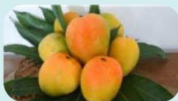
Gambar 5. Mangga Gedong

Berdasarkan hasil penelitian, pemaparan gas etilen dengan konsentrasi 30 ppm selama 24 jam paling efisien dan efektif untuk memacu pematangan seragam pada buah mangga gedong, warna yang khas dari mangga gedong menandakan mangga tersebut sudah matang sempurna yaitu warna kuning orange. Pelunakan buah merupakan akibat dari degradasi polisakarida dan reaksi enzimatik yang dikatalisis oleh enzim glycanases , glicosidase , dan esterase .