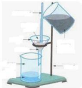
Filtração por gravidade

2. A cada uma das figuras seguintes associe o nome da operação unitária correspondente.