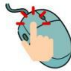
Klik satu kali dan tahan