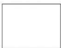
Una cartulina blanca