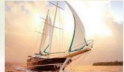
Lực gió tác dụng vào buồm