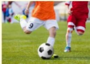
Lực sút vào quả bóng