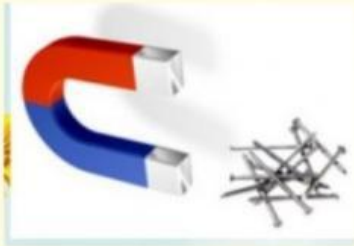
Lực hút của nam châm