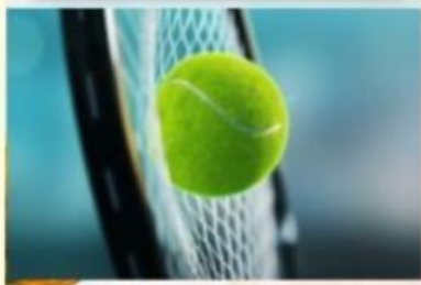
Lực quả bóng tác dụng vào vật