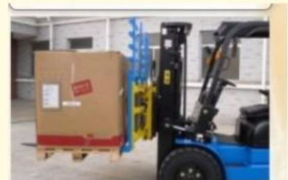
Lực của xe đẩy hàng