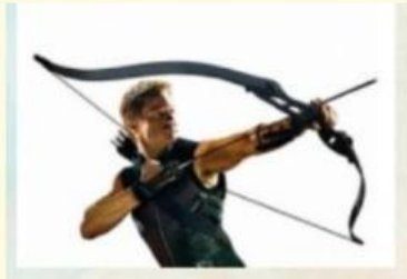
Lực kéo dây cung