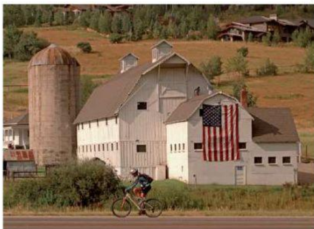
◆ Granero en Utah, Estados Unidos.