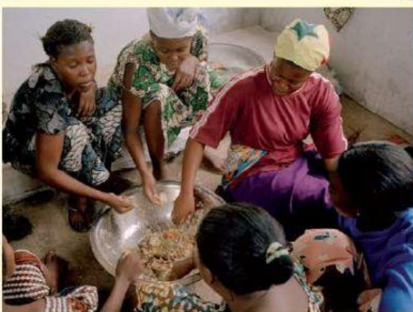
♦ Mujeres en Ziguinchor, Senegal