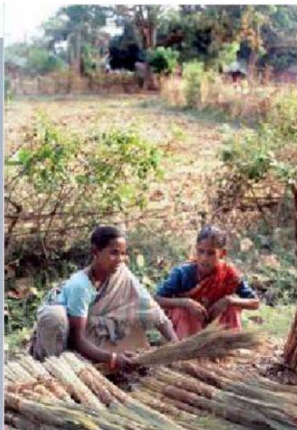
◆ Pueblo rural en Orissa, India.