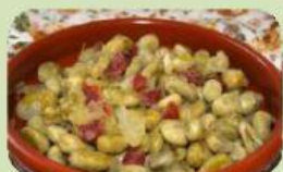
Habas con Jamón Granada