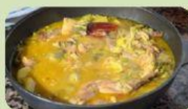
Gurullos con Conejo Almería