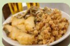
Pescaíto Frito Sevilla