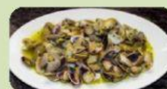
Coquinas al ajillo Huelva