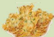
Tortilla de Camarón Cádiz