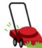
CORTADORA DE CÉSPED