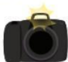
CÁMARA DE FOTOS DIGITAL

1. ¿CUÁLES DE ESTOS OBJETOS SON COMPUTADORAS O CONTIENEN COMPUTADORAS QUE LOS AYUDAN A FUNCIONAR?