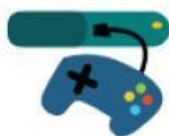
CONSOLA DE JUEGOS