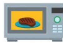
HORNO DE MICROONDAS