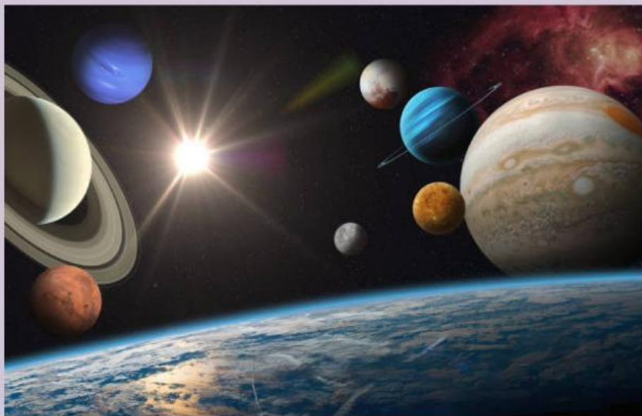
Gambar : Allah pencipta alam semesta

Rukun iman adalah dasar kepercayaan dalam Islam yang wajib diamalkan oleh orang yang beriman. Kata 'rukun' sendiri memiliki arti dasar atau pokok yang harus dikerjakan. Sementara 'iman' bermakna yakin atau percaya. Umat Islam wajib memahami dan mengamalkan tiap rukun iman di kehidupan sehari-hari.