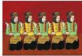
Gambar 2.7. Boneka Saman