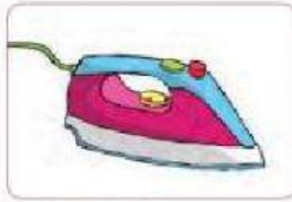
Gambar 2.10. Setrika