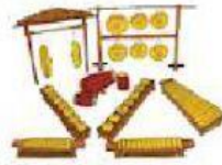
Gambar 2.17 Alat musik gamelan