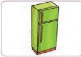
Gambar 2.11. Lemari pendingin