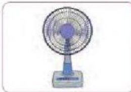
Gambar 2.9. Kipas Angin