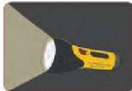
Gambar 2.8. Lampu senter